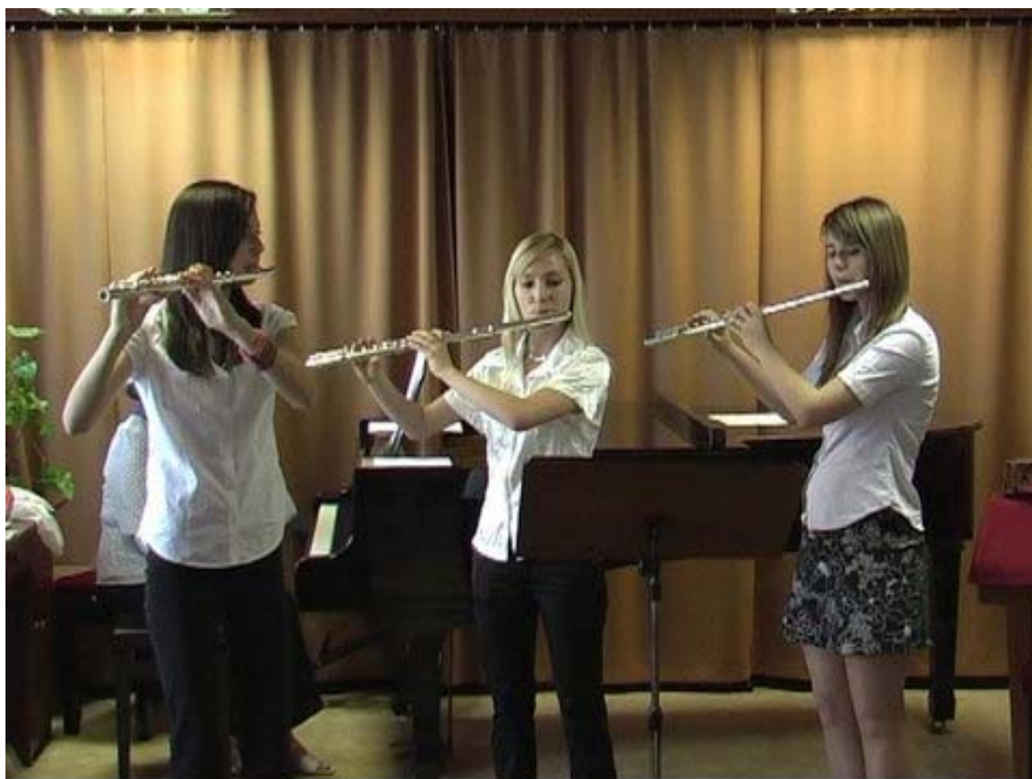
2. ábra: a trió, a szerző darabjának ősbemutatóján.