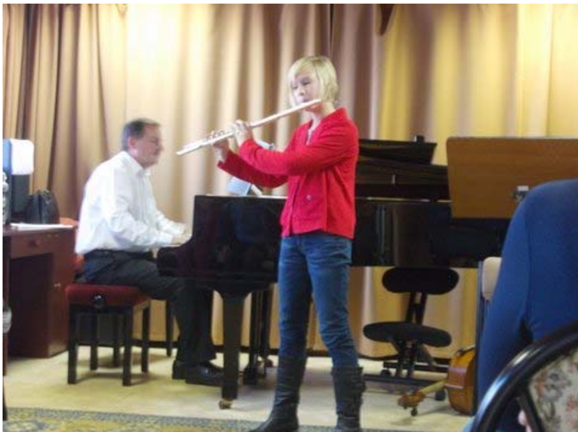
4. ábra: Sz. Bora növendékem

A hangszeritanítás célirányos és fejlesztő pedagógiai tevékenység, amelynek középpontjában a hangszerkezelés képességeinek megismertetése, fejlesztése áll. Ez egy összetett folyamat, amelynek részei az iskolai órák, az otthoni gyakorlások, a nyilvános hangversenyek, a vizsgák, a versenyek. A fellépések, a szereplések a növendékek, a szülők, a tanárok számára is nagy jelentőségűek, hiszen ezek az alkalmak az eddig elvégzett munka eredményeit tükrözik. A nyilvános megjelenések azonban nem minden hangszer tanuló gyermek számára jelentenek sikerélményt, ezeket gyakran kíséri csalódás, kudarc érzése.