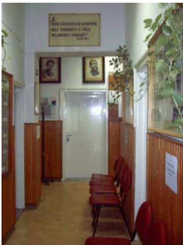
3. ábra: a dorogi Erkel Ferenc AMI képei